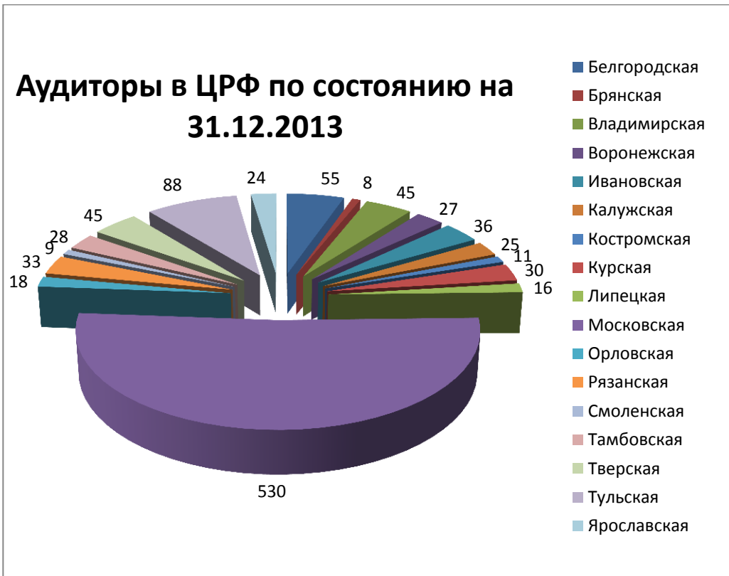
Рис. Территориальная структура членской базы СРО НП АПР, состоящих на учете в ЦРФ.